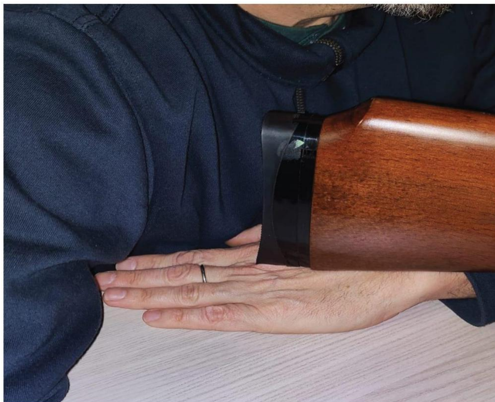
Posizione di tiro non corretta